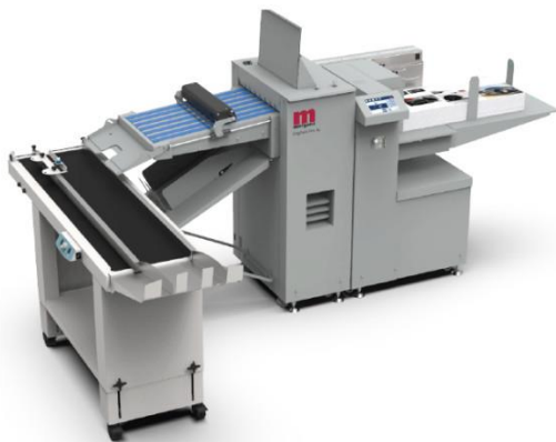
The DigiFold Pro XL connected with the BST-4000 Beltstacker

Morgana er gået X-Large med mange af deres produkter