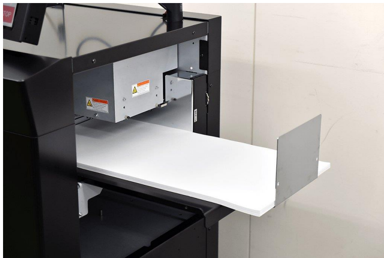
Ark format helt op til 370 x 750 mm med patenteret 3-sug feeder