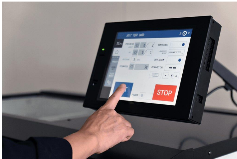
Enkel betjening via stor farveskærm