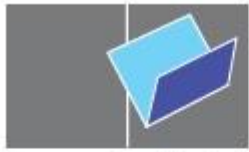
One crease (for a thin book)