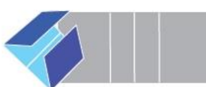
Open Gate Fold with creased line