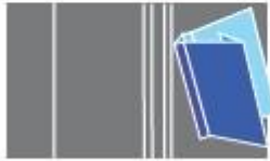
Five creases for spine, hinge and flap