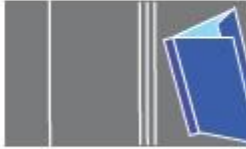
Four creases for flat spine, hinge and flap