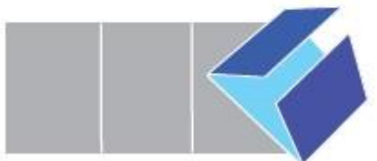
Open Gate Fold