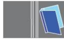
Four creases (spine and hinge)