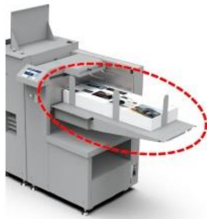
Nem loading af papir i den nye top-feeder med plads til lange ark