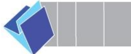
Double Parallel Fold