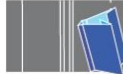
Six creases for spine, hinge and double flap